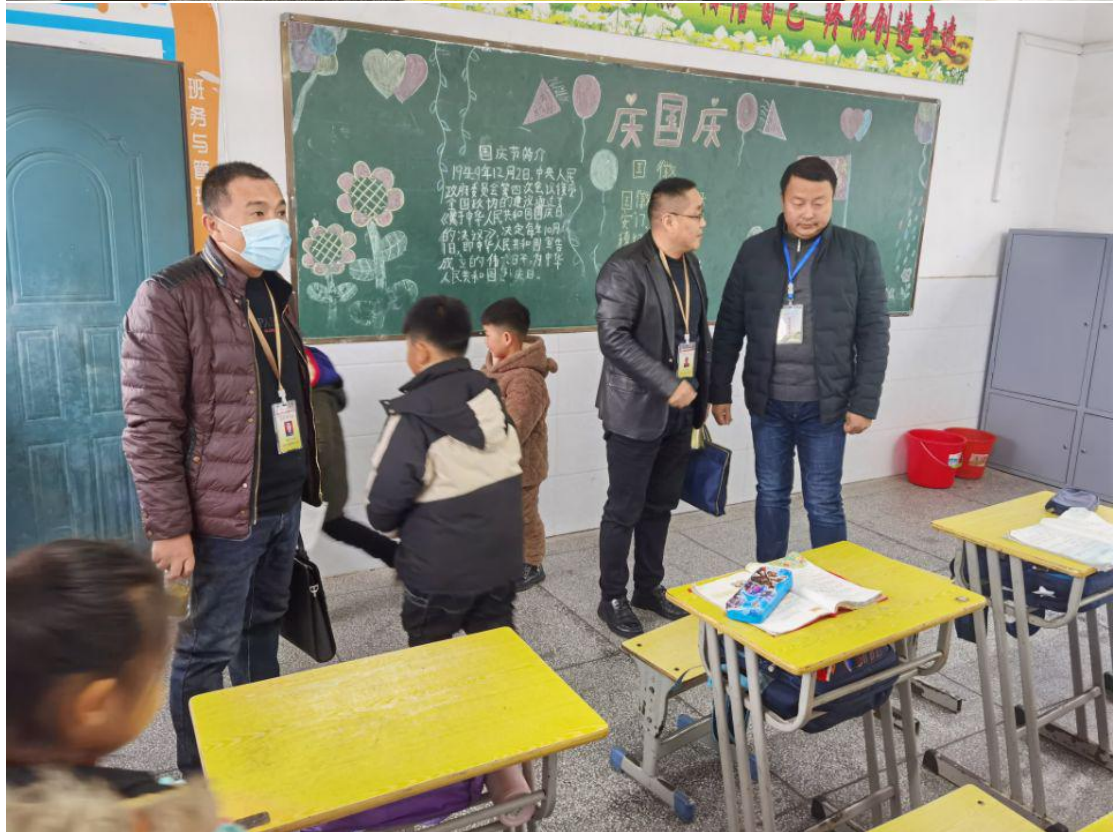
两位督学在庞岗小学会议室，查看了史院学区党支部第二党小组的活动记录、党员学习手册、党小组会议记录，同时对我们