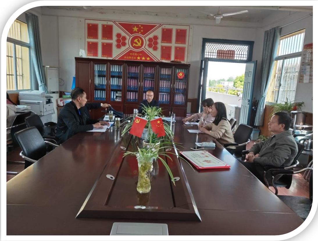
督学和上课教师进行交流