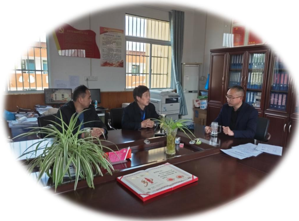
督学听取学校樊校长汇报