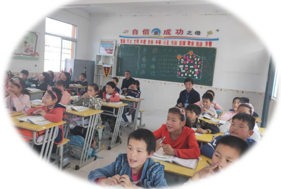
督学们深入课堂听课